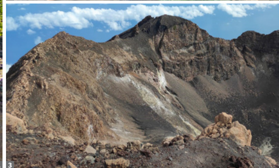
1 Santo Antão, Paúl Tal 2 Markt in Praia 3 Pico de Fogo