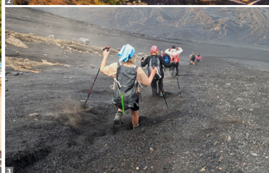
2 Santo Antão 3 Abstieg vom Pico do Fogo