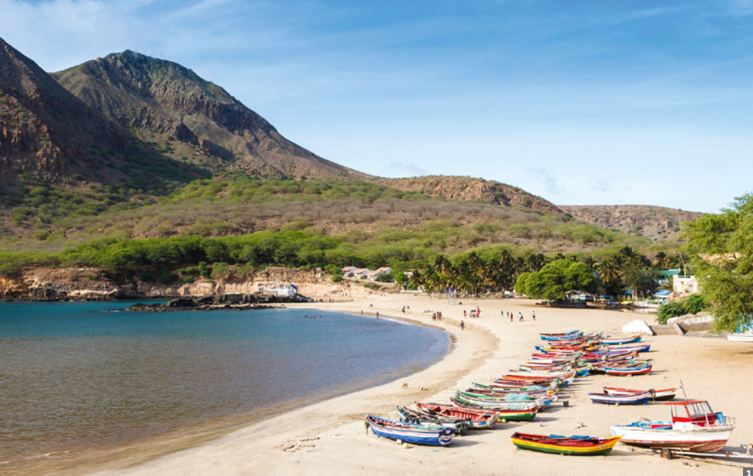
1 Tarrafal