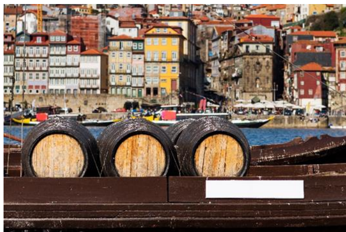
Rabelo Boot, Porto