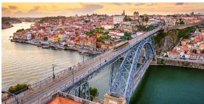
Dom Luis Brücke, Porto