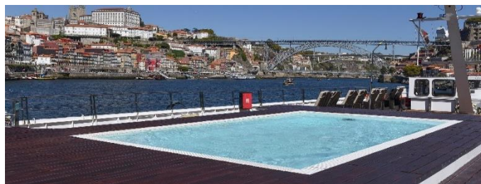
Pool am Sonnendeck

*Kat. G & J: keine Einzelbelegung möglich