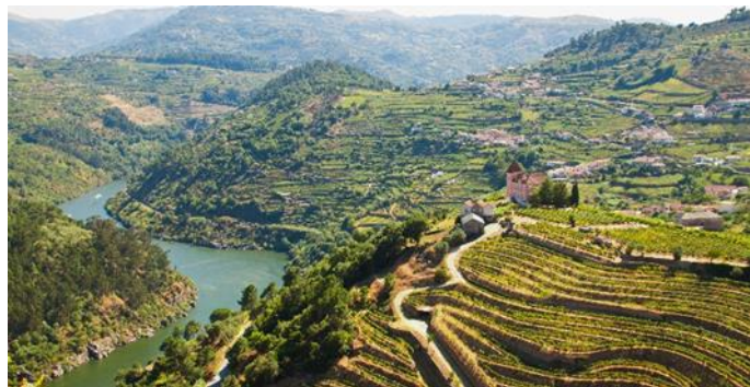
Weinterrassen Douro Tal

Flug garantiert LH-Group (Austrian, Lufthansa, Swiss)