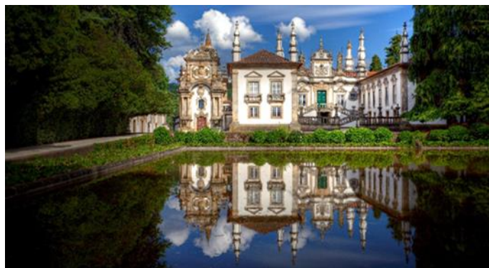
Schloss Mateus, Vila Real