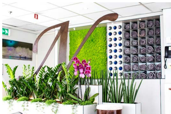
MS Nestroy, Fitnesscenter