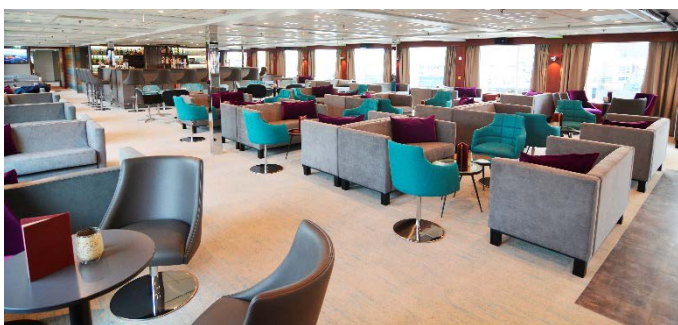
MS Nestroy, Bar/Lounge