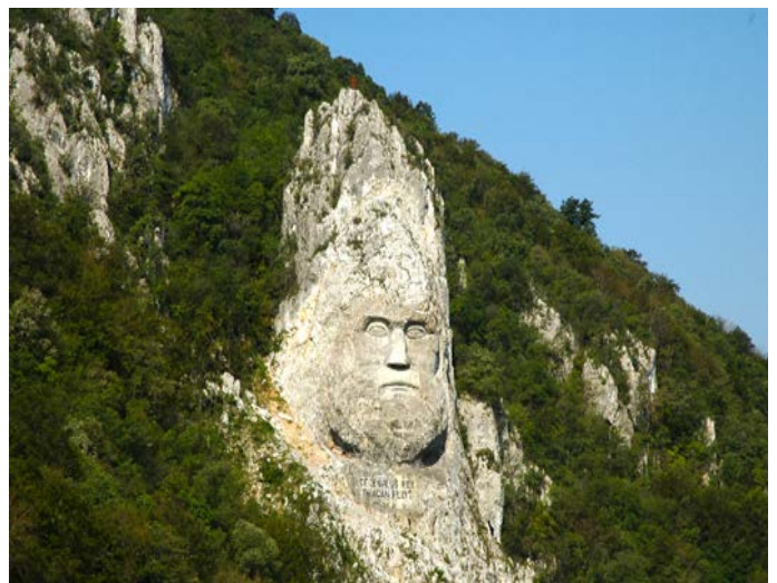
König Decebalus / „Eisernes Tor“