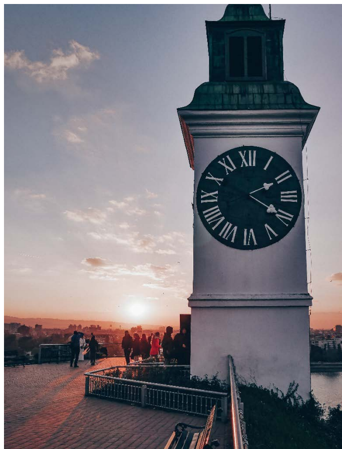
Novi Sad, Petrovaradin