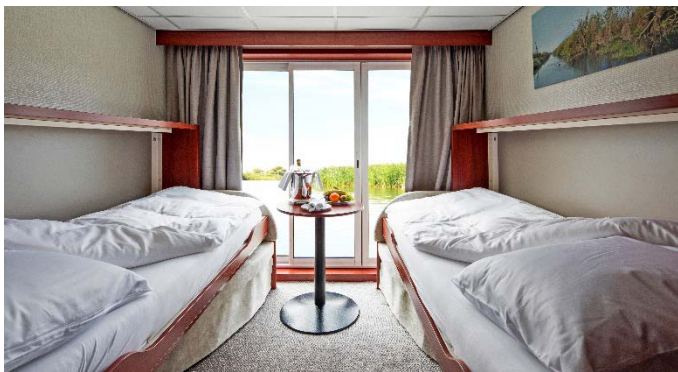
MS Nestroy, Zweibett-Kabine Schiller- bzw. Goethedeck