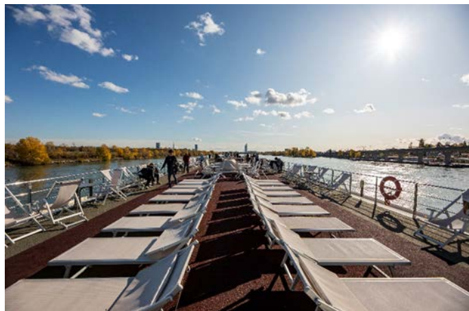
MS Nestroy, Sonnendeck

Schon am frühen Morgen erreicht das Schiff Wien. Nach einem letzten Frühstück an Bord sagen wir schließlich der MS Nestroy Lebewohl.