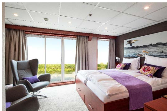
MS Nestroy, Suite Schiller- bzw. Goethedeck