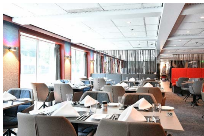
MS Nestroy, Restaurant