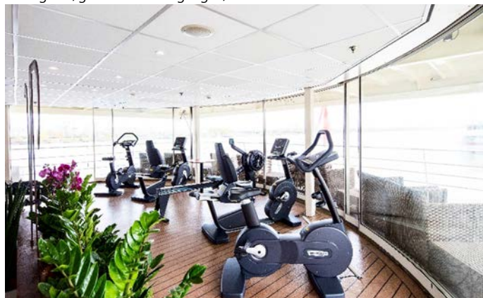
MS Nestroy, Fitnesscenter